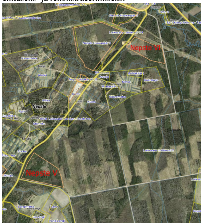
Joonis. Nepste V ja Nepste VI liivakarjääride asukohad (Maa- ja Ruumiamet)

Kavandatava tegevuse eesmärgiks on Pärnu maakonnas Häädemeeste vallas Nepste külas Laiksaare metskond 2 kinnistul 1 ehitus- ja täiteliiva kaevandamine, mida on plaanis kasutada tsiviil- ja teedehituses. Eelkõige kulub täitematerjali Rail Balticu ehitusele, kui ka lähipiirkonnas asuvate teede ehituseks- ja rekonstrueerimiseks.